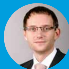
Petr Podhola Mgr. Petr Podhola Náměstek primátora pro školství a sociální věci